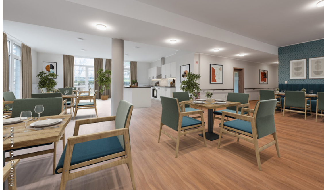
Einrichtung kann variieren